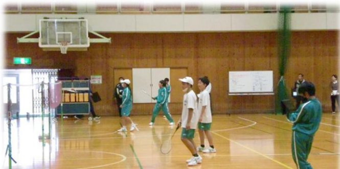
1年生 保健体育「バドミントン」